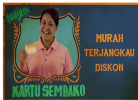
Gambar 1: Iklan Kreatif Jokowi-Ma'ruf pada Pilpres 2019 berfokus pada redaksional reward