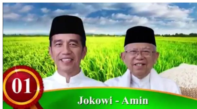
Gambar 3: Iklan Kreatif Jokowi-Ma'ruf pada Pilpres 2019 berfokus pada persuasi memilih no 1 pada pilpres

memiliki kondisi kesulitan keuangan akan menyambut baik program kartu sembako murah tersebut.