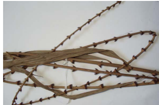
Gambar 3. Calamus erectus Griff.

Habitat Menjalar, pangkal daun berwarna orange, batang keras, dan memiliki sulur di ujung. Daun berbentuk pinnate dan berwarna hijau, tumbuh pada setiap ruas dengan panjang mencapai 75-80 cm dan lebar 20-30 cm. Pada ujung daun terdapat sirus. Pemanfaatan oleh masyarakat untuk tali, kursi, kaki meja, tiang tempat tidur, dan bagian yang digunakan yaitu batang. Nama Daerah: Ketang Belno.