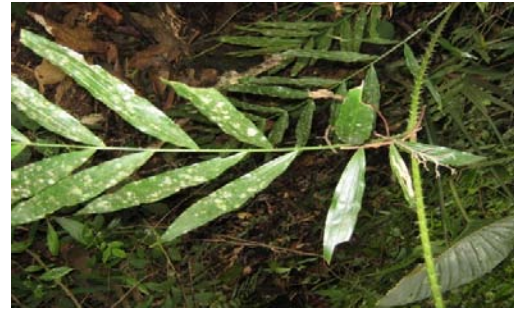
Gambar 10. Daemonorops geniculata (Griff) Mart.

Habitat menjalar, daun berselang, sulur di ujung, memiliki 3 duri, duri panjang, duri di pertulangan daun, dan di belakang daun di sisi kiri dan kanan. Pemanfaatan oleh masyarakat untuk pembuatan kaki kursi, dan bagian yang digunakan yaitu batang. Nama Daerah: Ketang bane.