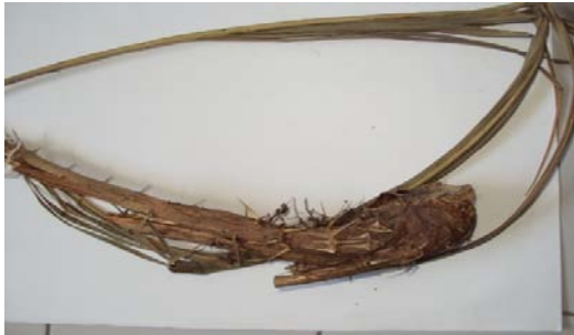
Gambar 8. Calamus scipionum Louere.

kursi, bingkai tangkok ikan diperoleh dari bagian batangnya. Nama daerah: Ketang Semambu.