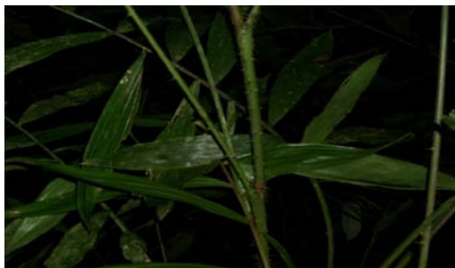
Gambar 5. Calamus insignis Griff.

di permukaan anak daun, dan daun terletak berselang seling. Tumbuh berumpun dan memanjat tinggi. Pada pelepah terdapat duri sampai ujung, duri menyebar pada batang dan berwarna hitam, susunan daun hampir sejajar, urat daun tidak jelas, permukaan atas dan bawah daun berduri halus dan jarang, tepi daun berduri lembut, tulang daun jelas, dan memiliki seludang diujung pelepah. Pemanfaatan oleh masyarakat untuk bahan perabotan dan kursi, bagian yang digunakan yaitu batang. Nama Daerah: Ketang Batu