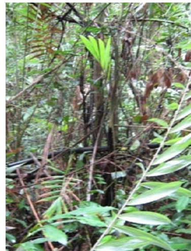
Gambar 14. Plepciopsis borneensis Becc.

Habitnya menjalar, daun kecil, sulur di ujung, batang berlapis, duri di kiri kanan daun, tepi dan memiliki satu duri pada batang. Pemanfaatan oleh masyarakat untuk Untuk pembuatan tali, kursi, perabotan, bagian yang digunakan yaitu batang. Nama Daerah: Ketang Buluh