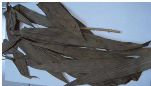
Gambar 6. Calamus leptostachys Becc.

Habitat Menjalar, sulur diujung, makin ke ujung makin besar, duri pada batang panjang merunduk, memiliki 3 duri, pada pertulangan daun ada duri, ujung daun meruncing, tumbuh berumpun, dan tinggi mencapai 20-25 m. Batang berdiameter 2-2,5 cm, diameter tanpa pelepah 1-1,5 cm, panjang ruas pada batang 4-5 cm, tinggi 60-65 cm, bentuk pipih, permukaan berduri, bentuk duri pipih, mengelilingi batang, ukuran duri 2-2,4 cm, jumlah duri 1-2 (2-6), jarang, merunduk ke bawah, dan berwarna coklat. Pemanfaatan oleh masyarakat untuk bahan perabotan, dan bagian yang digunakan yaitu batang. Nama Daerah : Ketang Ronti.