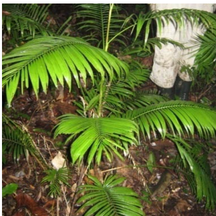
Gambar 2. Calamus axillaris Becc.

Habitat menjalar, sulur di ujung, daun kecil berselang, daun ujung berbentuk V, batang merah, dan daun di kiri kanan berduri. Daun berbentuk pinnate dan berwarna hijau, tumbuh pada setiap ruas dengan panjang mencapai 75-80 cm dan lebar 20-30 cm, pada ujung daun terdapat sirus dengan panjang 45-50 cm. Anak daun memiliki duri yang tumbuh pada pelepah dan sepanjang rachilla dengan panjang 0,5-0,8 cm. Pangkal daun memiliki duri-duri halus dengan panjang 0,2-0,4 cm. Pemanfaatan oleh masyarakat untuk atap rumah dan perabotan dengan bagian yang digunakan yaitu batang. Nama daerah: Ketang Gara Pucuk.