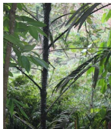
Gambar 11. Daemonorops sabot Becc.

Habitat menjalar, duri tumbuh melingkar seperti cincin, sulur di terminal daun, berumpun, tinggi sampai 15 m, diameter batang sampai 3 cm (tanpa pelepah sampai 1,5 cm), dan panjang ruas sampai 15 cm. Pelepah hijau kekuningan, duri tersusun melingkar, luruh jika telah tua/kering, warna hitam kecoklatan, panjang 1-6 cm dan lutut berkembang. Panjang daun sampai 250 cm, panjang tangkai sampai 40 cm, surus sampai 100 cm, tangkai daun bagian bawah berduri hitam, tersusun terpisah atau dalam kelompok, terdiri atas 20 helaian daun di tiap sisi tulang daun, dan tersusun dalam kelompok 3-6 helaian. Perbungaan jantan berwarna kuning dan menggantung. Pemanfaatan oleh masyarakat untuk bahan perabotan, dan tali, dengan batang sebagai bagian yang digunakan. Nama Daerah: Ketang Cincin.