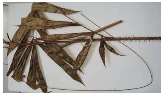
Gambar 4. Calamus discolor Mart.

Habitat Menjalar, sulur tumbuh dari ketiak daun, duri mengelilingi batang, dan memiliki duri berselang seling. Pada ujung daun terdapat sirus dengan panjang 45-50 cm. Anak daun berbentuk lanceolate , ujung anak daun berbentuk runcing ( acute ), berjumlah 17-20 helai dan daun terletak berseling. Pangkal daun terdapat duri-duri halus dengan panjang 0,2-0,4 cm. Pemanfaatan oleh masyarakat sebagai bahan perabotan dan tali, dan bagian yang digunakan yaitu batang. Nama Daerah: Ketang Beras.