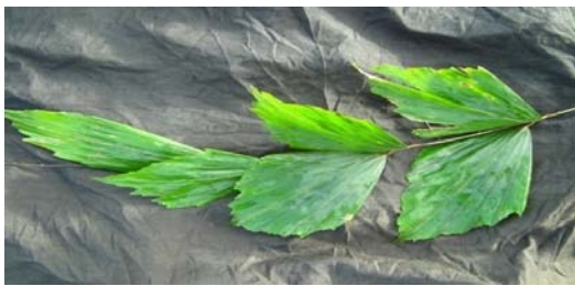
Gambar 12. Korthasia rigida Blume.

tepi, dan letak daun berselang seling. Diameter batang sampai 1,5 cm (tanpa pelepah sampai 0,5 cm) dan panjang ruas sampai 20 cm. Pelepah daun hijau pucat, kadang-kadang tertutup oleh bintik-bintik berwarna abu-abu dan coklat, duri jarang dengan panjang sampai 1 cm. Selaput bumbung sampai 4 cm, menempel erat pada batang, tidak berduri. Panjang daun sampai 100 cm, tangkai daun sampai 10 cm dan cirrus sampai 50 cm. Helaian daun berjumlah 5-6 di tiap sisi tulang daun, permukaan atas berwarna hijau tua sampai pucat, permukaan bawah hijau keabu-abuan, berbentuk belah ketupat, ukuran sampai 15x8 cm. Pemanfaatan oleh masyarakat untuk bahan perabotan, bagian yang digunakan yaitu batang. Nama Daerah: Ketang dahan.