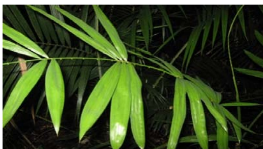
Gambar 9. Calamus tetradactylus Hance.

Habitat menjalar, sulur tumbuh di terminal daun, memiliki 3 duri, 3 daun, dan letak daun berhadapan. Daun berbentuk pinnate dan berwarna hijau, tumbuh pada setiap ruas dengan panjang mencapai 75-80 cm dan lebar 20-30 cm. Pada ujung daun terdapat surus dengan panjang 45-50 cm. Anak daun berbentuk lanceolate , ujung anak daun berbentuk runcing ( acute ), berjumlah 17-20 helai, tata letak daun tersusun berseling dengan panjang 8-22 cm dan lebar 2-4 cm. Duri tumbuh pada pelepah dan sepanjang rachilla dan panjang 0,5-0,8 cm. Pangkal daun terdapat duri halus dengan panjang 0,2-0,4 cm. Pemanfaatan oleh masyarakat untuk bahan perabotan, bagian yang digunakan yaitu batang. Nama Daerah: Ketang kacar.