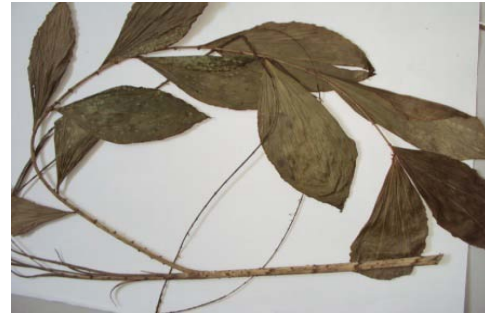
Gambar 13. Korthasia scaphigera Griff

Habitat menjalar, daunnya hampir mirip dengan ketupat, batang tidak bercabang, dan jumlah durinya sedikit. Tumbuh berumpun dan memanjat tinggi, batangnya merambat pada pohon atau ranting, diameter batang berpelepah 0,4-0,6 cm, batang berwarna coklat, terdapat sabut pada batang, panjang pelepah bersama seludang sekitar 60 cm, daun berwarna hijau tua, permukaan daun berduri halus, tepi daun bergelombang, susunan daun sejajar, pelepah memiliki serbuk, duri berwarna hitam, serta jumlah tiap rumpun mencapai 10 batang. Pemanfaatan oleh masyarakat untuk perabotan dan bingkai tanggok ikan, dan bagian yang digunakan yaitu batang. Nama Daerah: Ketang Kempen.