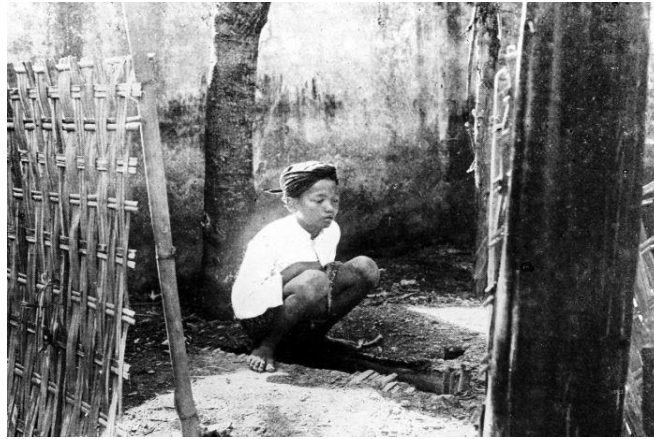
Gambar. 1. Salah satu remaja sedang buang hajat di Jumbleng, 1900

Bilik tersebut terbuat dari anyaman bambu yang direkatkan satu sama lainnya. Terkadang anyaman bambu tersebut hanya diikat atau di taruh di kanan kiri dan dimuka orang yang buang hajat tersebut. Penggunaan bambu sebagai media penghalang tidak lepas dari faktor kepraktisan dan kemudahan. Bambu merupakan bahan yang mudah didapat, bambu terdapat di sekitar sungai, di tengah perkampungan.