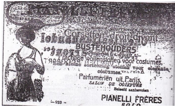
Gambar 4. Iklan perlengkapan busana wanita mulai dari korset, sarung tangan dan pakaian dalam dalam De Nieuwe Vorstenlanden , 8 Desember 1911

Kuatnya hegemoni para pemodal untuk mempromosikan dagangannya, membentuk piramida “kebersihan” dengan melahirkan konsep higienis. Konsep yang tidak pernah muncul dalam benak masyarakat Jawa sebelum abad ke XX. Higienis menjadi sebuah budaya baru yang diagung-agungkan di kalangan masyarakat. Gerakan penduduk pada pertengahan awal abad XX tersebut dalam hal konsumtif tersebut merupakan instrumen yang sangat cukup signifikan untuk menjelaskan gaya hidup, sehingga tingkah laku yang seperti demikian tersebut merupakan penanda sebuah identitas seseorang (Abdullah, 2008, pp. 32). Kaum terdidik berlomba-lomba membangun citra dan identitasnya dengan segala sesuatu yang baru, misalnya pulpen, topi, celana, sabun, roti dan sebagainya. Penggunaan barang-barang modern tersebut menunjukkan kelas masyarakat penggunaannya.