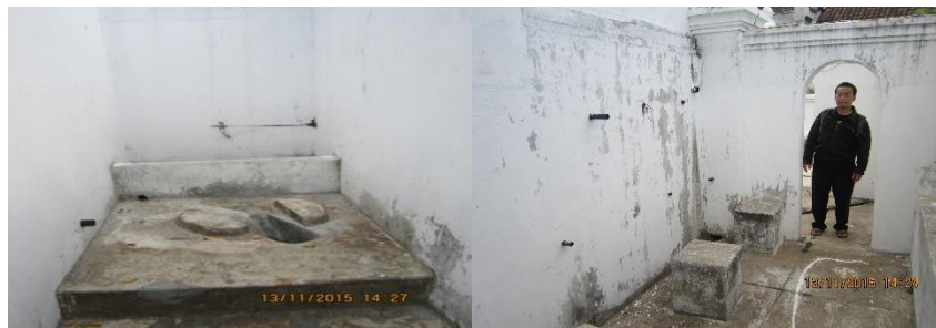
Gambar 4. Pemandian Ngebrusan yang dibangun oleh Mangkunegaran VII tahun 1937

Kamar mandi dan toilet adalah tempat kegiatan yang sifatnya paling pribadi, sehingga konsep-konsep privasitasi sangat dipentingkan. Ruang yang cenderung sempit dan simetris menunjukkan bagaimana penerimaan masyarakat Surakarta dalam kebudayaan kolonial dalam hal membangun kamar mandi dan toilet. Hal mana dalam pembangunan kamar mandi umum dan toilet umum mulai memisahkan pemandian estri dan jaler serta menyempitkan ruang-ruang toilet menjadi kecil dan privat.