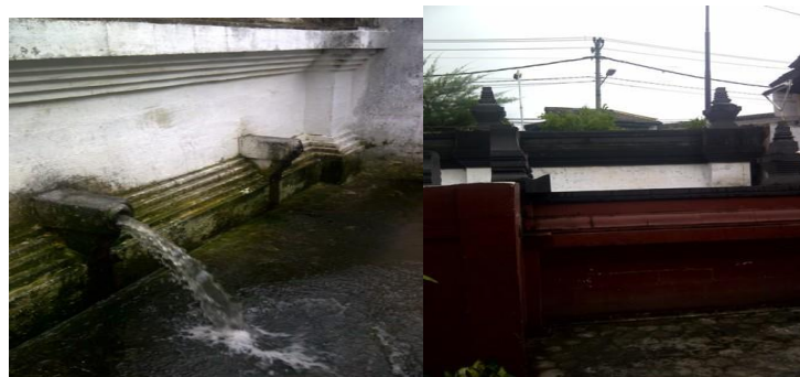
Gambar 5. Candi Donotirto yang sampai saat ini masih dipergunakan oleh masyarakat Yogyakarta sebagai tempat mandi dan mencuci

Namun tidak demikian halnya dengan kerajaan di Yogyakarta. Meskipun konsep silang budaya yang dianut oleh Karsten hampir menghegemoni seluruh pemikiran raja Jawa saat itu, akan tetapi resistensi pemerintah kerajaan Yogyakarta terhadap budaya Belanda membuat karakter bangunan yang ada berbeda dengan di Surakarta. Kamar mandi dan toilet yang diperuntukkan bagi masyarakat Yogyakarta misalnya, lebih mengedepankan nuansa kejawaannya daripada budaya kolonialnya.