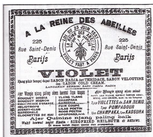
Gambar 3. Iklan sabun dan wewangian di surat kabar Pewartar Betawi , 13 Februari 1886

Iklan cenderung membentuk pasar baru dan mendidik kaum muda untuk menjadi sebuah konsumen. Kelas terdidik merupakan komponen yang membantu terjadinya sebuah hegemoni budaya (Simon, 2004, pp. 33). Pada abad itu hampir tidak ada kekuatan yang cukup berkuasa untuk mengendalikan laju iklan. Bahkan ketika oplah percetakan surat kabar, dan buku-buku sedang turun, iklan-iklan itu mampu menopang keberadaan percetakan-percetakan tersebut sehingga tetap mampu berdiri tegak. Hal ini karena modal-modal percetakan tersebut besasal dari pembuatan iklan yang dilakukan oleh para industri-industri tersebut (Riyanto, 2000, pp. 85). Akibat menjamurnya iklan tersebut sejumlah orang-orang bumi putra, penduduk pribumi yang berada pada kota-kota metropolitan, hampir sampai terlempar pada batas-batas kolonialisme.