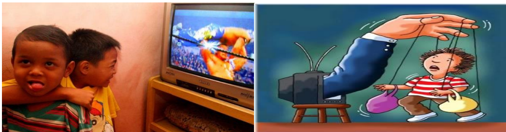
Gambar 2: Pengaruh Media

Mengingat media masa memiliki pengaruh terhadap kehidupan social satu kelompok masyarakat dan hanya menempatkan public sebagai konsumen. Karena itu perlu kiranya melaksanakan Pendidikan melek media. Pemahaman ini penting bagi para pegiat pendidikan melek media agar mampu melakukan kritik terhadap berbagai media yang melanggar aturan dan etika media yang ada di Indonesia. Sehingga terhindar dari pemberitaan bohong (hoax) di dunia yang sesak media ini.