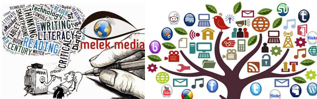
Gambar 4: Literasi Media

Literasi media berasal dari bahasa Inggris yaitu Media Literacy , terdiri dari dua suku kata Media berarti tempat pertukaran pesan dan Literacy berarti melek, kemudian dikenal dengan istilah literasi media. Dalam hal ini literasi media merujuk kemampuan khalayak yang melek terhadap media dan pesan media massa dalam konteks komunikasi masa. Padanan kata istilah literasi media juga dikenal dengan istilah melek media pada dasarnya memiliki maksud sama (Tamburaka, 2013: 7).