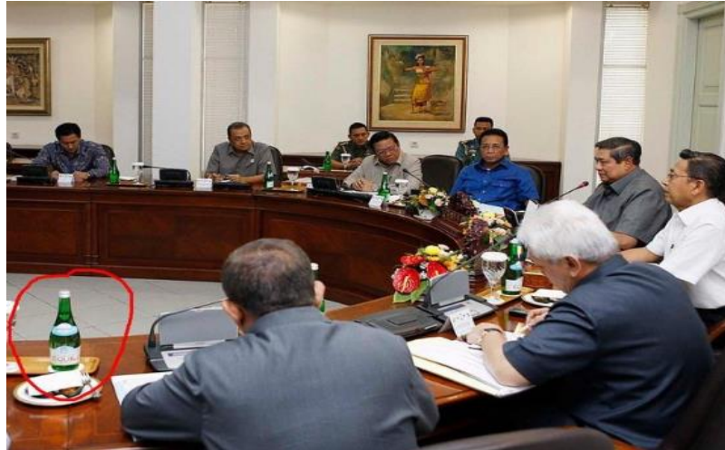
Gambar 7: Equil Pada Rapat Era SBY