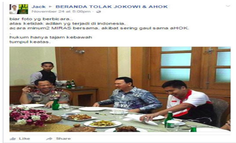
Gambar 5: Foto Dan Narasi Postingan Akun Jack