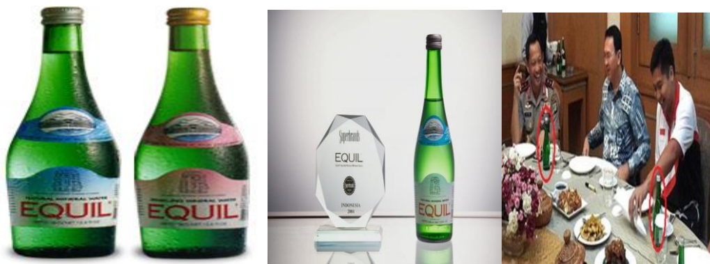
Gambar 6: Air Mineral Equil

Botol minuman di atas meja bukanlah miras (minuman keras) seperti yang dituduhkan melainkan air mineral merk Equil.