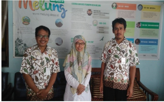
Gambar3. Kepala Desa Melung (kiri), peneliti (tengah), sekdes (kanan)