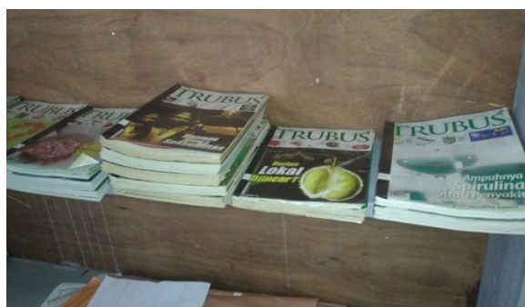
Gambar4. Susunan Koleksi Perpustakaan “Seneng Maca”