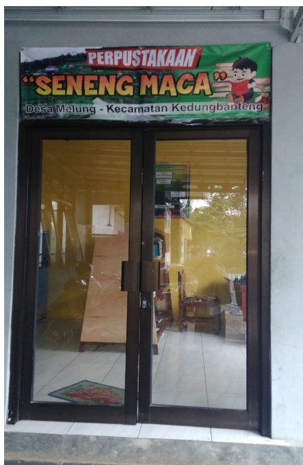
Gambar2. Perpustakaan "Seneng Maca"

Bagi masyarakat desa yang lekat dengan kesederhanaan, kadang masih menilai buku adalah barang mahal/mewah. Dalam sebuah penelitian di MIM Gandatapa Sumbang, Banyumas (masih satu kabupaten dengan desa Melung) menunjukkan bahwa sebagian besar anak tidak diberi hadiah buku bacaan oleh orang tuanya. (Antasari 2017)