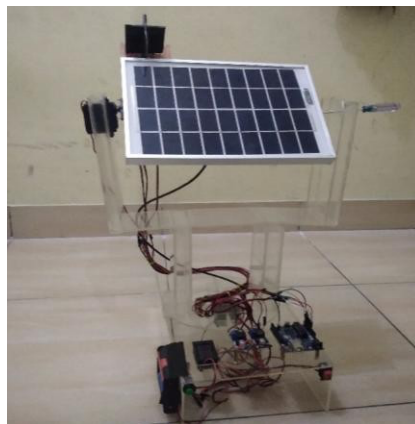
Gambar 2. Rancangan Panel Surya

Hasil dari rancangan alat dan realisasi desain mekanis dari sistem yang telah direncanakan. Adapun langkah untuk perancangan mekanik sistem yaitu pemilihan bahan yang akan digunakan untuk kerangka. Setelah bahan didapat, dibentuklah susunan tersebut untuk menjadi penyangga panel surya dan komponen lainnya.