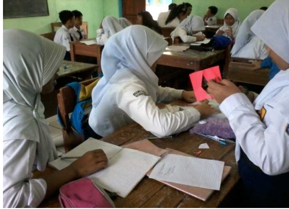
Gambar 1. Aktivitas Siswa Ketika Pembelajaran ARIAS Berlangsung

Untuk mengukur peningkatan kemampuan pemahaman matematis, peneliti mengujikan 7 buah butir soal. Soal-soal yang diujikan dalam penelitian ini termasuk dalam kategori mudah, sedang dan sukar. Penyusunan soal tes kemampuan pemahaman diklasifikasikan kepada kemampuan pemahaman instrumental dan relasional. Hal ini disebabkan karena kemampuan siswa kelas VII SMP Negeri 3 Lembang bervariasi, informasi ini diperoleh peneliti sebelumnya ketika peneliti mengadakan observasi lapangan dan wawancara dengan salah seorang guru di sekolah tersebut. Adapun ketika proses pembelajaran ARIAS, guru berperan mengaitkan materi pelajaran dengan pelajaran yang telah dipelajari oleh siswa sebelumnya dan mengaitkan materi pelajaran dengan kehidupan sehari-hari siswa, disamping itu guru memberikan penguatan kepada siswa apabila menemukan kesulitan ketika proses pembelajaran ARIAS berlangsung. Contoh gambar aktivitas siswa saat melakukan proses pembelajaran di kelas.