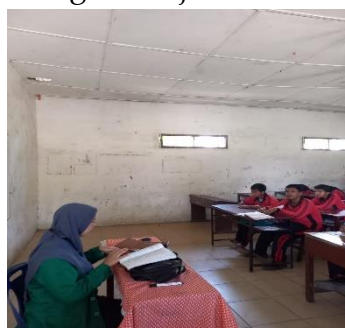
Gambar 4. Mengajar MTS