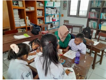
Gambar 6. Mengajar SD