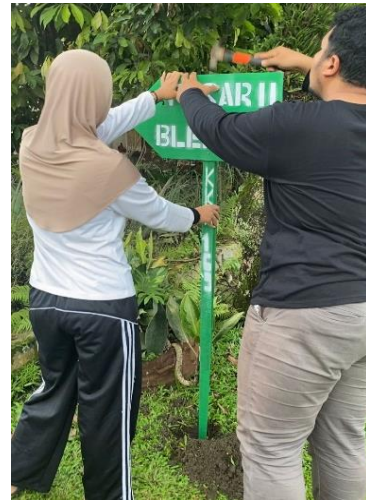
Gambar 13. Pemasangan plang pembatas jalan