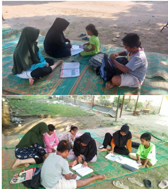
Gambar 8. Mengajar rumah gembira