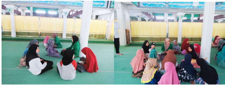
Gambar 11. Mengajar di Rumah Tahfiz