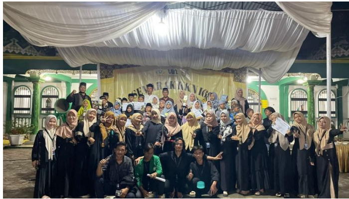
Gambar 12. Semarak KKN