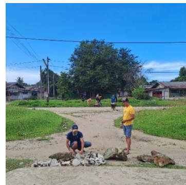
Gambar 1. Gotong royong Bersama warga