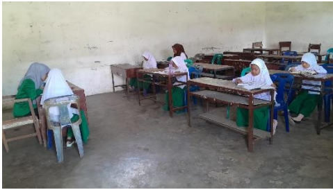
Gambar 5. Mengajar MDTA