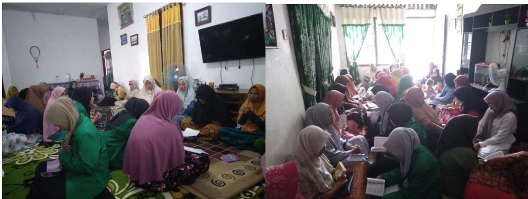
Gambar 10. Menghadiri Wirid

Mahasiswa KNN diundang oleh masyarakat untuk menghadiri acara rutinitas di desa bah Jambi yaitu acara wirid setiap hari kamis dan jumat. Kegiatan ini dilakukan selama 2 minggu. Dengan diadakannya acara wirid dapat membantu terjalinnya tali siraturahmi antar masyarakat di desa Bah jambi dengan Mahasiswa-mahasiswi KKN UINSU.