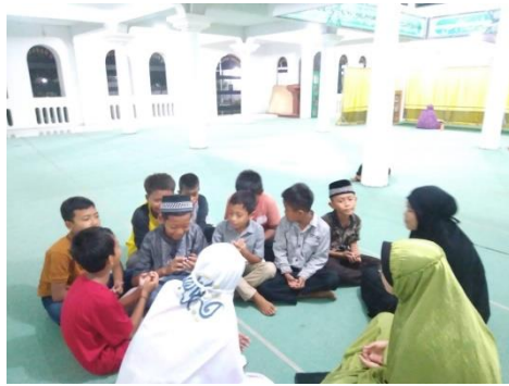
Gambar 9. Mengajar Magrib Mengaji