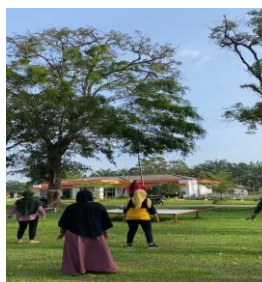
Gambar 2. Senam pagi hari Bersama ibu desa Bah Jambi

Ibu-ibu PTPN IV desa Bah Jambi melakukan senam rutin di tanggal 22 Juli dan mengajak mahasiswa KKN 169 untuk meramaikan kegiatan harian. Setiap hari sabtu nya mahasiswa KKN hadir dan ikut serta untuk menjaga kebugaran tubuh.