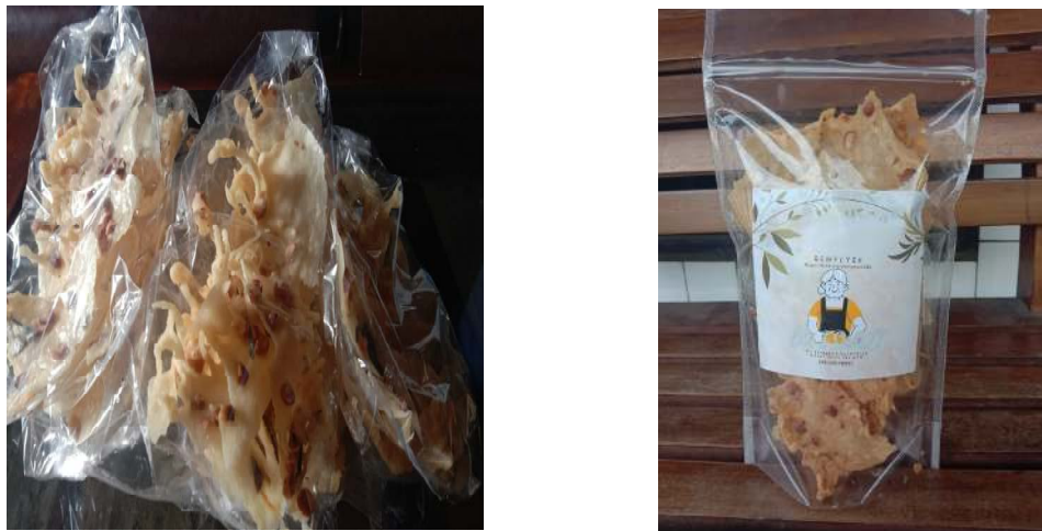
Gambar 2. Desain kemasan baru (kanan) dan desain kemasan lama (kiri) peyek Bu Eswati