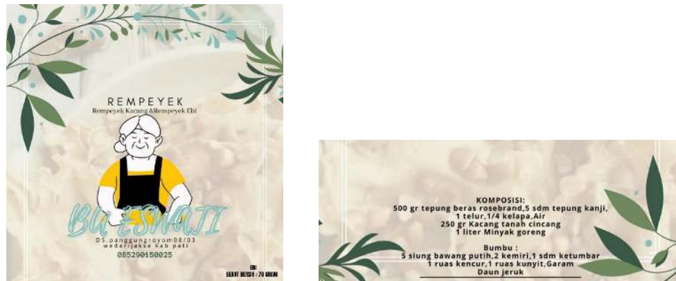
Gambar 1. Label Kemasan

mencantumkan klaim kesehatan atau klaim gizi. Kemasan produk didesain sesuai dengan jenis peyek yang diproduksi, yaitu peyek kacang (Candra Ningsih, 2020). Pada Gambar 1 menunjukkan label produk yang telah didesain dan telah disetujui oleh mitra sebagai desain label dari produk peyek Bu Eswati. Gambar 2 sebelah kiri merupakan kemasan produk lama dari peyek Bu Eswati yaitu kemasan hanya menggunakan plastik polipropilena biasa tanpa label kemasan, sedangkan kemasan sebelah kanan merupakan kemasan baru yang diusulkan pendamping yaitu kemasan menggunakan standing pouch dengan menempelkan stiker label pada kemasan tersebut sehingga kemasan lebih terlihat menarik dari sebelumnya.