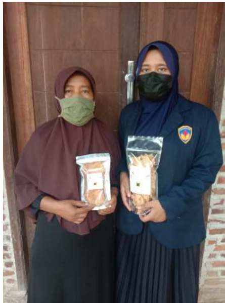
Gambar 4. Serah terima kemasan baru

Pada tahap ini dilakukan tahap evaluasi yaitu evaluasi tampilan desain kemasan yang terbaru serta pembuatan akun media sosial untuk penjualan untuk meningkatkan pemasaran produk lebih luas lagi.