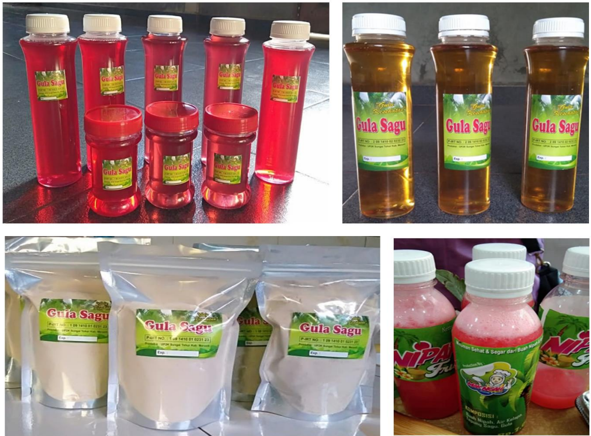
Gambar 1. Hasil penyuluhan untuk perbaikan mutu, kemasan, dan variasi produk gula sagu cair dan serbuk