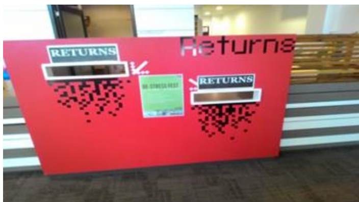
Tempat pengembalian koleksi habis pinjam