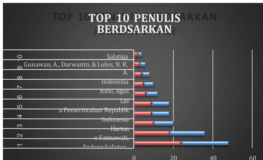
Grafik Diagram Batang 3. Menunjukkan TOP 10 Penulis