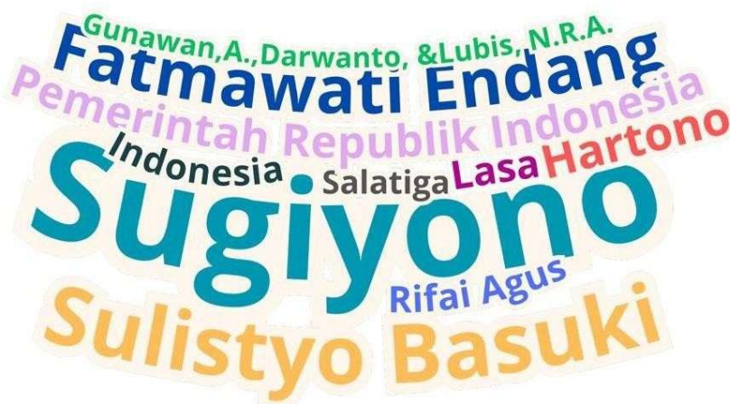
Gambar 1. Format Word Cloud

Selain melakukan analisis sitasi, penulis juga menampilkan visualisasi tabel frekuensi penulis dan word cloud untuk mengetahui penulis yang paling sering muncul pada sitasi artikel-artikel yang diterbitkan oleh Jurnal IQRA'. Visualisasi ini bertujuan untuk mengidentifikasi fokus kajian yang berkembang dalam bidang ilmu perpustakaan, informasi, dan kearsipan pada rentang tahun 2020–2025. Melalui word cloud, nama penulis yang memiliki frekuensi tinggi akan tampak lebih besar dibandingkan nama penulis lainnya sehingga memudahkan pembaca dalam mengenali produktivitas penulis yang paling sering muncul di sitasi dalam jurnal. 11