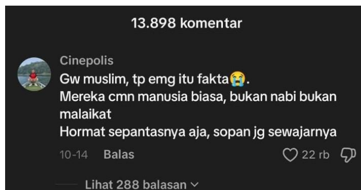
Gambar 4. Komentar netizen Cinepolis pada video akun TikTok Duniadian Kebudayaan (diakses 10 Desember 2025).

Pada ruang digital, sakralisasi terhadap figur kyai tidak lagi diterima secara mutlak, tetapi mulai mengalami dekonstruksi melalui berbagai pandangan kritis dari masyarakat. Otoritas yang sebelumnya dibangun melalui tradisi, simbol, serta hubungan hierarkis kini berhadapan dengan pola pikir yang lebih rasional dan reflektif. Akses media dan keterbukaan informasi mendorong masyarakat untuk melihat batas antara penghormatan dan pengkultusan, terutama ketika sosok kegamaan ditampilkan dalam konteks yang berbeda dari lingkungan pesantren. Kesakralan tidak lagi bersifat absolut, melainkan sesuatu yang dapat diperdebatkan, dinegosiasikan, dan bahkan dipertanyakan oleh publik secara luas.