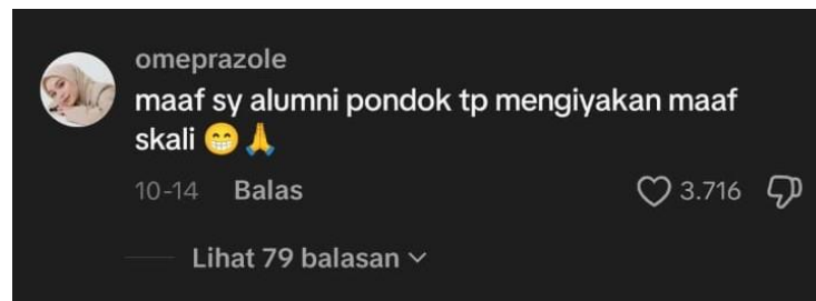
Gambar 5. Komentar netizen omeprazole pada video akun TikTok Duniadian Kebudayaan (diakses 10 Desember 2025).

ini menunjukkan bahwa resistensi tidak hanya datang dari luar komunitas pesantren. Posisi sebagai alumni memberikan bobot tersendiri pada kritik tersebut, karena ia berbicara dari pengalaman langsung berada dalam sistem nilai dan praktik pesantren (Solihin & Efendi, 2025). Kehadiran suara semacam ini memperlihatkan bahwa kritik terhadap otoritas kyai juga tumbuh dari dalam tradisi itu sendiri.