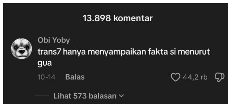
Gambar 2. Komentar netizen Obi Yoby pada video akun TikTok Duniadian Kebudayaan (diakses 10 Desember 2025).

Muncul pandangan yang menempatkan media sebagai penyampai realitas yang objektif. Tidak seluruh audiens memandang tayangan tersebut sebagai suatu penyimpangan, tetapi sebagai gambaran fakta yang sesungguhnya. Perbedaan dalam pandangan ini mengindikasikan bahwa media memiliki peranan penting sebagai sumber kebenaran bagi sebagian masyarakat. Keyakinan ini sekaligus menunjukkan bahwa media tidak hanya menyampaikan informasi, tetapi juga berkontribusi dalam membentuk perspektif masyarakat terhadap suatu peristiwa.