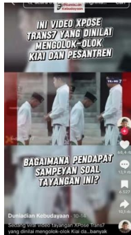
Gambar 1. Cuplikan video tayangan Xpose Trans7 yang diunggah akun TikTok Duniadian Kebudayaan (diunggah 14 Oktober 2025, diakses 10 Desember 2025).

Tayangan ini dapat dipahami sebagai praktik produksi wacana oleh media. Media memiliki kuasa untuk membingkai realitas sosial melalui representasi visual, termasuk dalam mendefinisikan bagaimana figur kyai ditampilkan dan dimaknai oleh khalayak. Dalam konteks ini, figur kyai yang selama ini diposisikan sebagai tokoh berwibawa dan penuh kharisma dalam struktur pesantren justru direpresentasikan dalam posisi yang dianggap merendahkan. Padahal, dalam tradisi pesantren, otoritas kyai dibangun melalui kombinasi antara keteladanan moral, penguasaan ilmu agama, serta relasi hierarkis yang kuat dengan santri (Ramdan & Usman, 2021). Hal ini menunjukkan bahwa otoritas keagamaan tidak hanya diproduksi dan dipertahankan melalui institusi pesantren, tetapi juga dapat dinegosiasikan, bahkan diganggu, melalui representasi media massa (Solihin & Efendi, 2025).